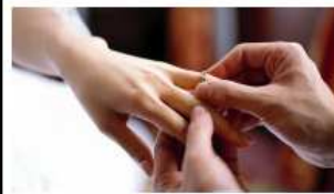
Családalapítás, párválasztás - házasság