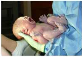
Születés - keresztség