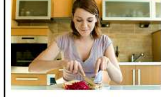
Táplálkozás - Oltáriszentség