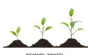
Növekedés - bérmaiás