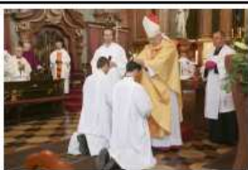
Papi hivatás - papszentelés