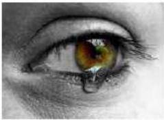
Bűnbánat – Bűnbánat szentsége