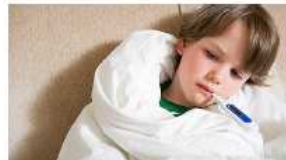
Betegség – betegek kenete